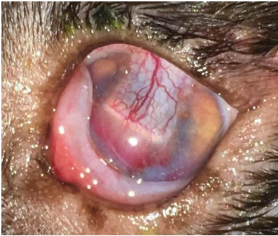
Ouverture tarso à J11