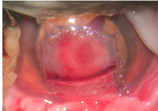
Grefe cornéo conjonctivale